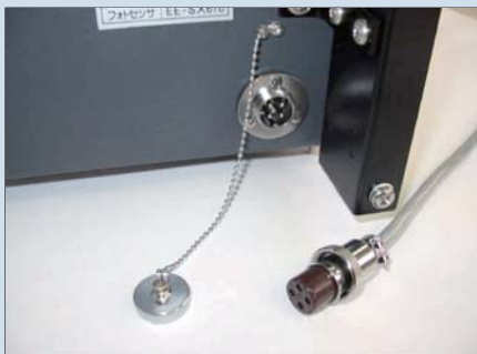
● Da型パルス発信器 Transmitter Receptacle