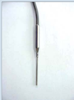
● Ptセンサ (ガス温/液温測定用) Pt sensor(Measurement for Gas temperature/ liquid temperature)