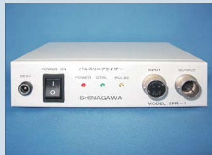
● パルスリニアライザー Pulse Linearizer

特 徴 封液：シリコンオイル、デッドスペース付 主要材質 ケース, 計量ドラム：ステンレス鋼 (SUS 304) 切削加工部品:黄銅(C3604BD)接合部:半田溶接 圧力損失 Pressure loss 100Pa 使用圧力範囲 Operating Pressure Limits 5kPa 使用温度範囲 Operating Temperature Limits 40°C