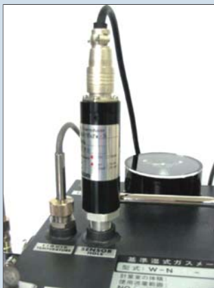
● 圧力センサ(VPRN-A2-1000型) 0~10kPa=1~5V DC出力 Pressur sensor(Model=VPRN-A2-1000) 0~10kPa=1~5V DC output