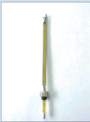
● 温差補正計 (ガス温/液温測定用、40°C) Temperature compensator for percent scale (for Gas temperature/for liquid temperature 40°C)