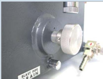
● 液面調整器 Liquid Level Adjuster